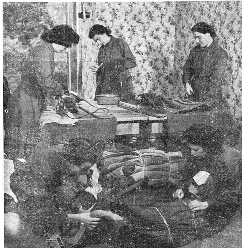
Un atelier du S. C. de nettoyage et d'assortiment des uniformes.

Quand «ils» auront trouvé un seul argument valable, mais un vrai, contre le suffrage féminin, je consentirai alors à n'être plus féministe. S. B.