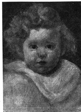
Cliché «Pro Infirmis»

Voici que le printemps nous ramène la vente des cartes de Pro Infirmis — cette vente qui constitue l'essentiel des ressources annuelles de cette œuvre admirable. Grâce à elle, en effet, des êtres qui végéteraient dans l'isolement et dans l'ignorance sont entourés, soignés, réduits: des sourds-muets apprennent à communiquer avec leurs semblables; des aveugles peuvent lire, des épileptiques sont soignés, des arriérés se développent, des infirmes et des estropiés de naissance sont pourvus d'appareils spéciaux... Tous, autant que faire se peut, apprennent un métier adapté à leurs possibilités et qui leur donnera le courage de l'indépendance. Tâche magnifique en vérité que de rendre ainsi à l'existence normale les victimes de la vie: aussi ne pouvons-nous qu'encourager chaudement nos lecteurs à s'associer à l'achat des cartes qui leur seront présentées.