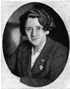
Ellen WILKINSON Ministre de l'Éducation