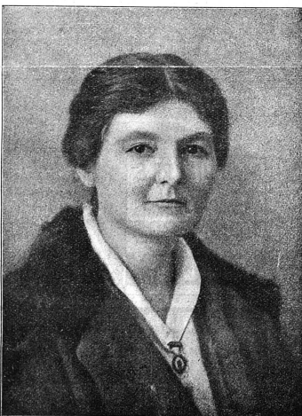
Cliché Mouvement Féministe