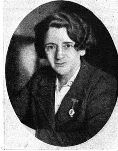
Cliché Mouvement Féministe.