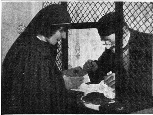
Cliche Mouvement Féministe