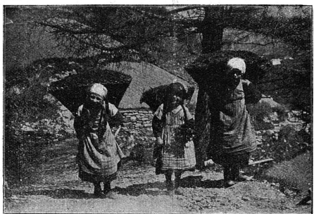
En Valais. Trois montagnardes