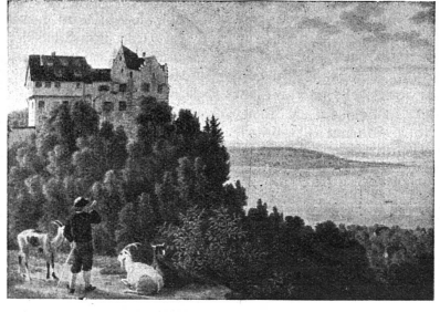
Château de Salenstein

On voit que les buts à atteindre ne manquent pas, que chacun de ces services nécessite des efforts suivis et coûteux. Ne refusez pas votre appui à cette œuvre utile.