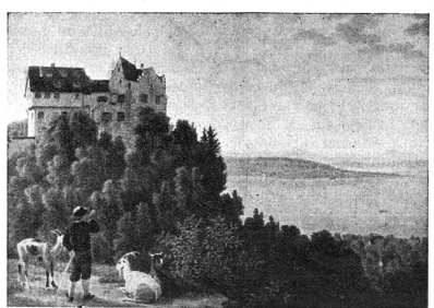
Château de Salenstein

On voit que les buts à atteindre ne manquent pas, que chacun de ces services nécessite des efforts suivis et coûteux. Ne refusez pas votre appui à cette œuvre utile.