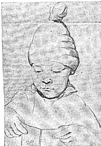
Dessin de Frida Heim