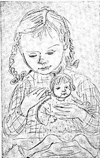
Dessin de V. Constantin