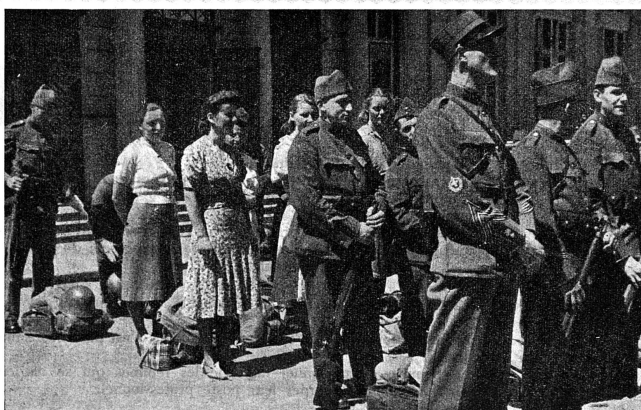
Equipe de cuisinières licenciée en même temps que la troupe en 1940. C'est un document rare : ces SCF n'ont pas encore d'uniforme

Le Conseil fédéral a reconnu la nécessité de la participation des femmes à notre défense nationale, et se fonde sur les expériences faites pendant le service actif de 1939-1945. Il a fixé l'organisation de la plus jeune formation de notre armée par l'ordonnance du 12 novembre 1948.