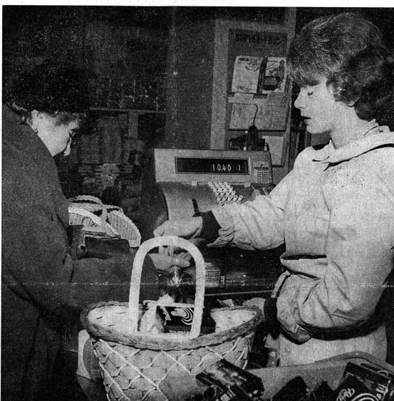
Les femmes représentent le 29% de l'ensemble de la main-d'œuvre, en Suisse.