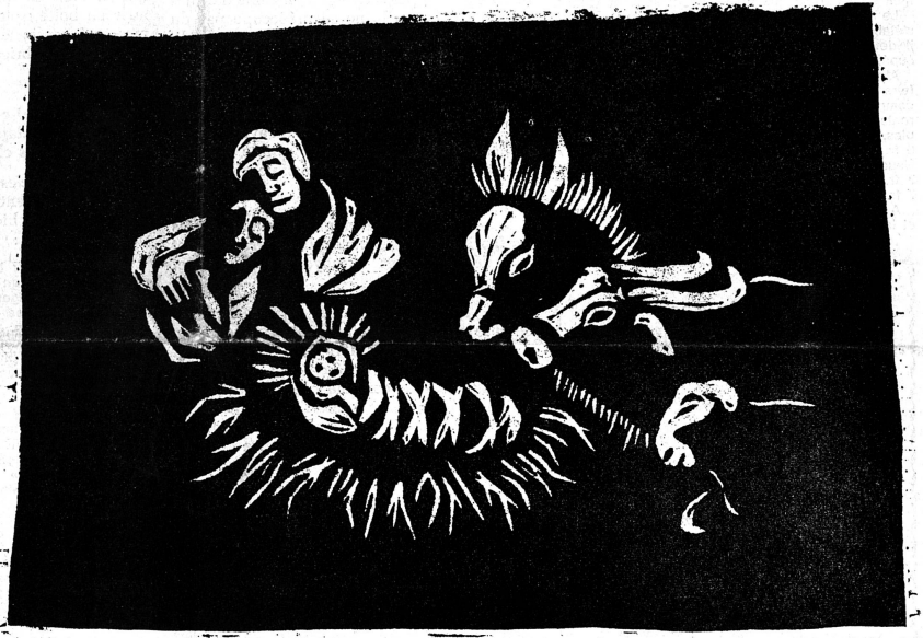
Bois gravé de Ruth Steinegger