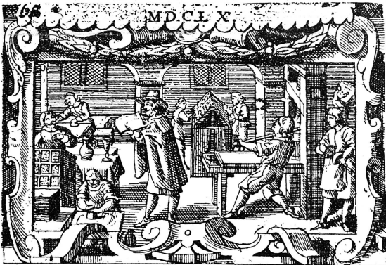
Intérieur d'imprimerie pris dans un livre du XVII e siècle. On voit représenté tout le personnel nécessaire; les deux compositeurs n'ont pas de copie sous les yeux, mais composent sous la dictée d'un lecteur, ou anagoste, installé au fond à droite, qui déchiffre le manuscrit. (D'après l'interprétation du bibliographe Madden).

LA GLORIEUSE ÉPOQUE DE GRANDS IMPRIMEURS-ÉDITEURS