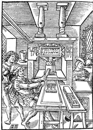
Marque de Jehan de Roigny, fameux imprimeur qui travailla à Paris, de 1529 à 1565. Il avait épousé une des filles de Josse Bade, imprimeur également. C'est une femme compositrice qui est à la casse.

Le confrère cite encore une grève déclenchée en 1863, contre l'imprimeur bien connu Paul Dupont, pour l'obliger à congédier son atelier de femmes en invoquant la loi saïque (!) comme base de cette prétention. Ces quelques informations sur l'histoire de la femme dans la typographie (cette histoire n'est pas encore écrite, avec aux historiennes) permettent de constater que la récente admission des jeunes filles à l'apprentissage de la typographie n'est qu'un retour tardif à une situation vieille de plusieurs siècles et qui avait subi une éclipse fort peu justifiée.