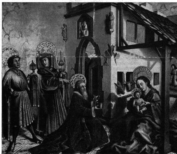
Conrad Witz: « L'Adoration des Mages »

suicide? Et les femmes ne devraient-elles pas avoir compris aussi que cette société qui les fond dans le même moule, qui les déshabille, les expose, ne les courtise qu'en apparence pour mieux les mépriser, les traiter plus en esclaves qu'en êtres humains?