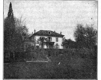
La maison de la famille Gourd, à Pregny

S'il faut attendre longtemps encore cette assurance maternité révisée, faut-il, pendant