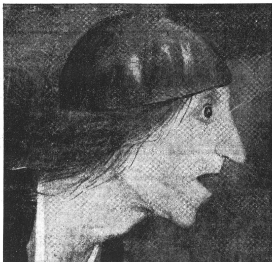
... cette « Margot l'Enragée » de Bruegel (détail)