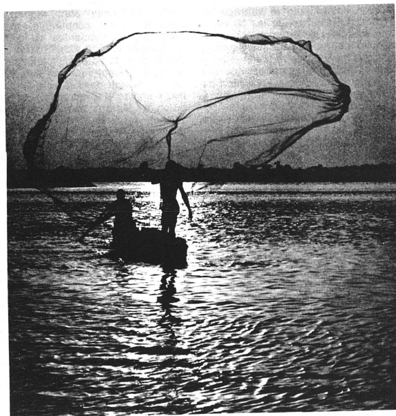
qui centre actuellement son action sur l'Inde et le Tchad. C.C.P. Lausanne 10 - 1533.

Etre toujours prêt à jouir de la beauté du monde et des choses