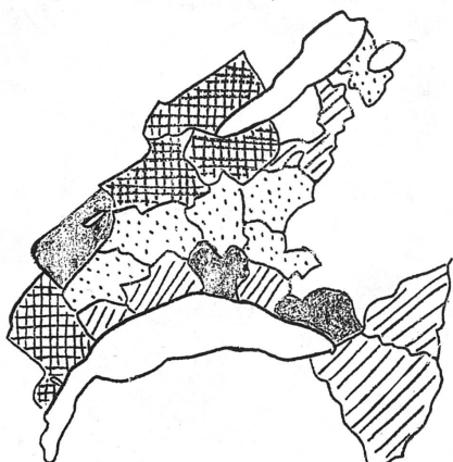
Proportion des femmes exerçant une profession

Il existe une relation certaine entre l'importance de la population féminine professionnelle active et la façon dont la femme est acceptée dans la vie politique