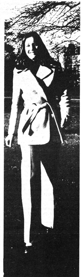
Des horizons plus vastes.