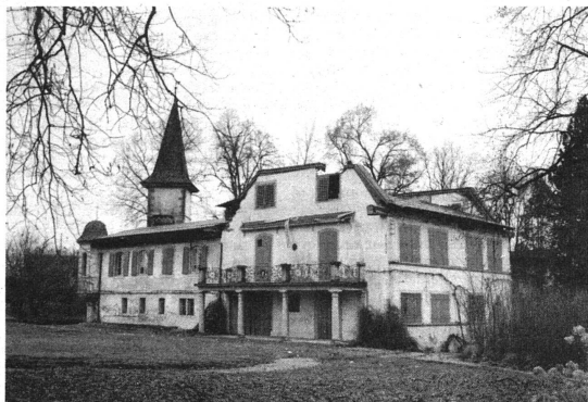
La nuit du 3 au 4 novembre 1974, la maison de Gonzague de Reynold, à Cressier/Morat, était la proie des flammes. Les combles furent entièrement détruits, ainsi que le second étage. Planchers, boiserie, plafonds, furent gravement endommagés par l'eau, ainsi que les peintures murales qui ornaient les pièces de réception.

Cette demeure, où naquit Gonzague de Reynold et où son œuvre vit le jour, était dès le XIII e siècle possession des sires de Cressier, dont l'existence est attestée en 1179 dans l'acte de vente d'une terre par Rodolphe I er de Gruyère au couvent de Hauterive. En 1336, le chevalier Hermann de Cressier s'engage envers ses sujets de Cressier, Petit-Boesingen et Cormondse, à ne pas augmenter le cens dû à l'occasion du décès d'un seigneur. En 1402, la seigneurie de Cressier passe dans la famille de Praroman. Elle lui appartient encore en 1529. Au début du XVIII e siècle, leur descendante, Hélène de Reynold, l'apporte en dot à son époux Francesco Python, et en 1661 leur fille, Anne-Elisabeth Python, l'apporte à son tour à son mari, Jean-Ferdinand de Diesbach, mort sans postérité en 1896. Anne-Elisabeth Python confirma, par testament du 22 janvier 1708, la donation de Cressier à François de Reynold. Cet officier au service de France, lieutenant général des Armées du Roi, vécut à Paris et n'apporta que peu de transformations au château qui est resté jusqu'à nos jours dans la famille de Reynold. Depuis trois mois à l'état de ruines, celui-ci est aujourd'hui la propriété de la petite-fille de Gonzague de Reynold, Sabine de Muralt, fille de C.J. Burckhardt et de Marie-Elisabeth de Reynold.