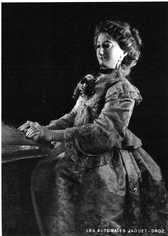
LES AUTOMATES JAOUET - DROZ.

Souvent, les gens du Bas, c'est-à-dire du Plateau suisse et des bords des lacs se plaignent à jouer les étonnés, surtout ceux bien installés sur leurs terres ou bien assis dans leur état de Confédéré moyen, lorsqu'ils abordent quelqu'un du Haut, lui demandant d'un air innocent: «Avez-vous de la neige à la Chaux-de-Fonds?» La formule est aussi quelconque et inévitable que celle du Parisien rencontrant un natif de Carcassonne, s'exclamant à tout coup: «Ah! Il y a des remparts à Carcassonne?»