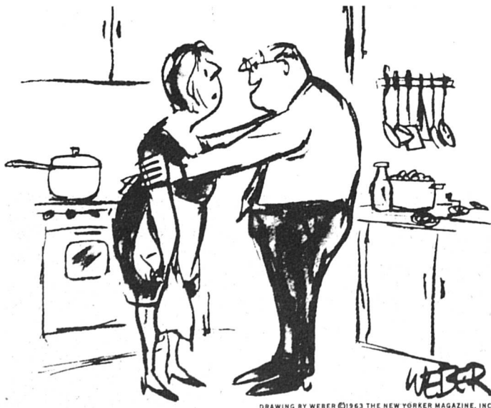
DRAWING BY WEBER © 1963 THE NEW YORKER MAGAZINE, INC.

Pendant la récession, la publicité a baissé de manière catastrophique. Les pages ont diminué parallèlement partout, des journalistes ont perdu leur poste, etc. Pourtant, lors de la grève des quotidiens genevois, le commerce local se ressentit immédiatement de l'interruption de la publicité, sans parler des cinémas et des fleuristes, puisqu'on ne savait quoi passer où, ni qui était mort et qui était né.