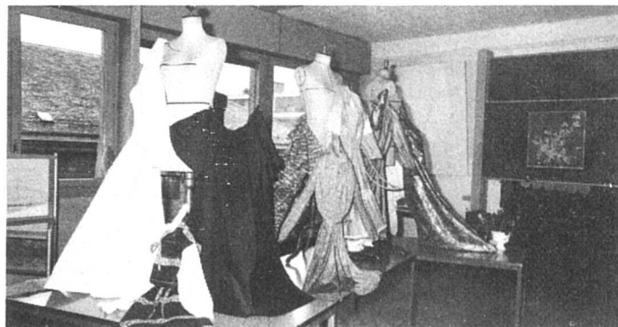
Elégance et finition

Un des grands avantages de ces cours d'adultes, c'est, à part un enseignement qualifié par des professeurs expérimentés, un matériel de