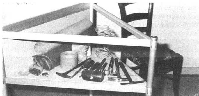
Les instruments du tapissier

Ces cours très variés, représentent en même temps qu'une amélioration de vos dons pratiques ou artistiques, une possibilité de contacts sociaux et amicaux bien précieux. Il n'y a pas de limite d'âge, de race