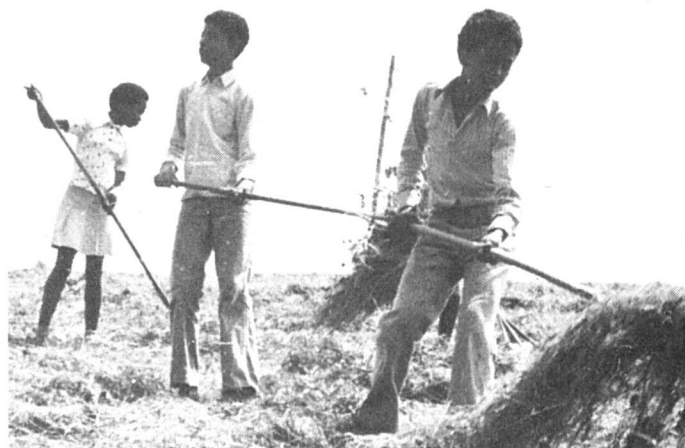
Office national suisse du tourisme.