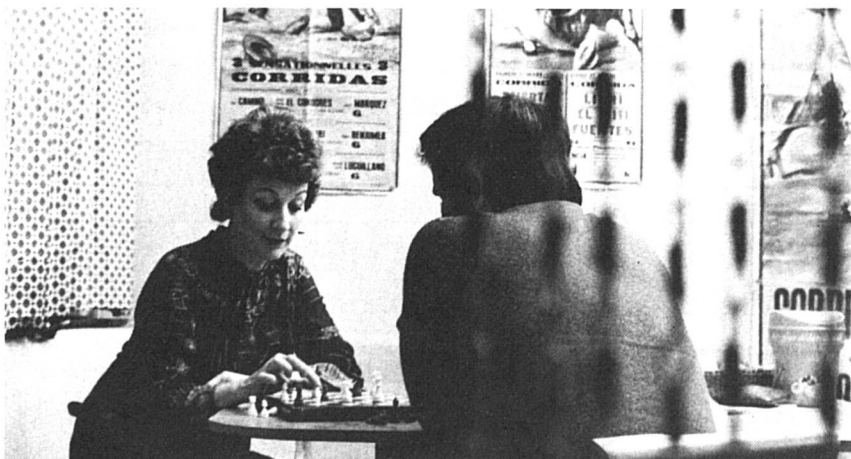
Echecs : Femmes Suisses est toute contente d'annoncer la naissance du « Centre d'échecs féminin ». Local : Brasserie de la Fontenette, 33 route de Veyrier à Carouge.