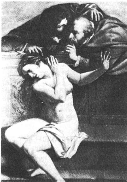
Des noms oubliés... Artemisia Gentileschi (1593-1652)

Les arts plastiques ne font pas exception : ce sont les hommes qui ont créé les grands courants de l'histoire de l'art. Les rares femmes peintres qui ont fait un métier de leur art, comme Artemisia Gentileschi à la Renaissance, ont été oubliées par l'histoire, ou, souvent, comme la sculptrice Adèle d'Affry, dite Marcello, elles y figurent sous leur pseudonyme masculin. Il ne faut pas croire pour autant que les femmes n'ont pas exercé d'activité plastique pendant des siècles ; il existe un grand nombre d'aquarelles, de pastels, d'huiles, de tapisseries, chefs-d'œuvre jamais