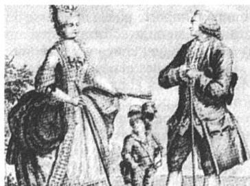
La mode naissait chez les seigneurs...

L'idée était toujours d'avoir l'air le plus noble et le plus riche possible. Qui pouvait porter du drap ou du velours n'aurait jamais daigné porter bure ou droguet ; les hommes étaient quelquefois bien plus somptueux que leurs épouses (aux XVI e et XVII e siècles), les beaux officiers s'ornaient de plumes et de rubans. Mais les moines allaient nu-pieds, chaque métier se reconnaissait à l'habit, ce qui devait bien simplifier l'existence. Une faible trace de ces distinctions se retrouve dans les vestes de cotonnades des bouchers, aux trames différentes des boulangers et des charcutiers, etc.