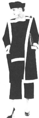
Modèle Nina Ricci

On va finir par croire qu'on s'est donné le mot!