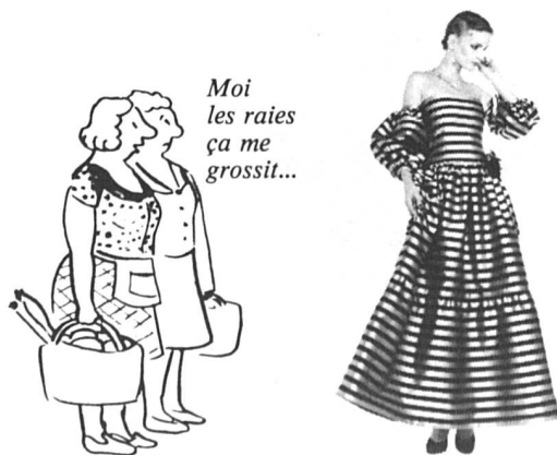
Modèle Nina Ricci