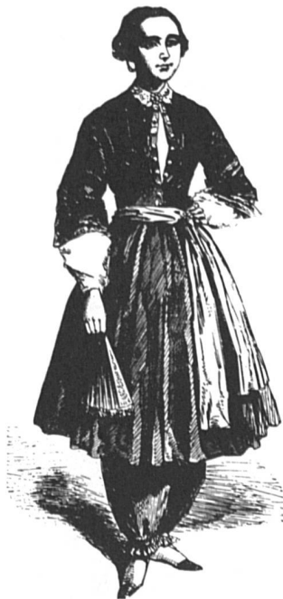
Amelia Bloomer et son costume.