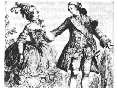
Gravure anonyme de 1788 B.N.