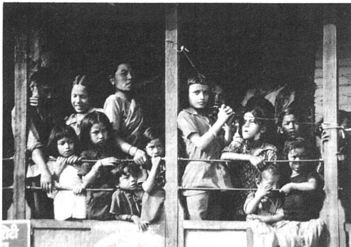
Pour elles, des lois nécessaires...