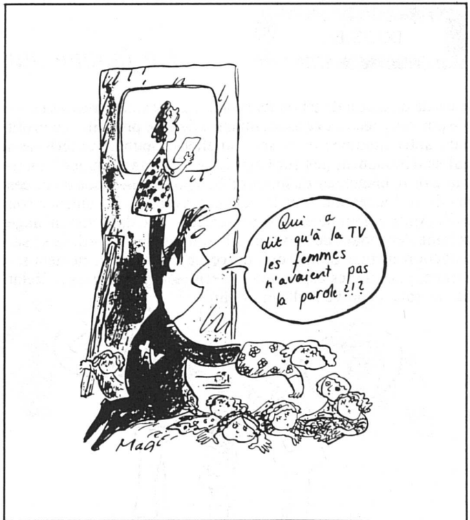
Dessin de Magi Wechsler

Quant aux émissions de variétés ou magazines radiophoniques et télévisés, ils n'utilisent les femmes qu'à titre de figurantes silencieuses, ou « d'objets décoratifs ». Les présentateurs ou animateurs de ces émissions sont en majorité des hommes, et à la radio, innombrables sont les émissions vraisemblablement écoutées par 2/3 de femmes qui font appel à des speakers masculins, en vertu de la règle émise par des spécialistes de marketing que les femmes préfèrent entendre la voix d'un homme... car la voix féminine, dit-on, « manque de conviction ».