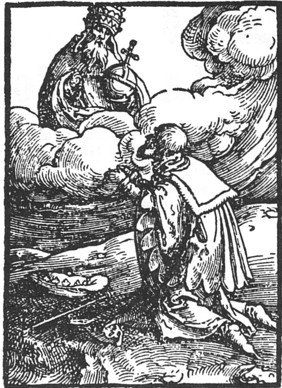
Gravures de Lucus van Leyden, XVI e siècle.