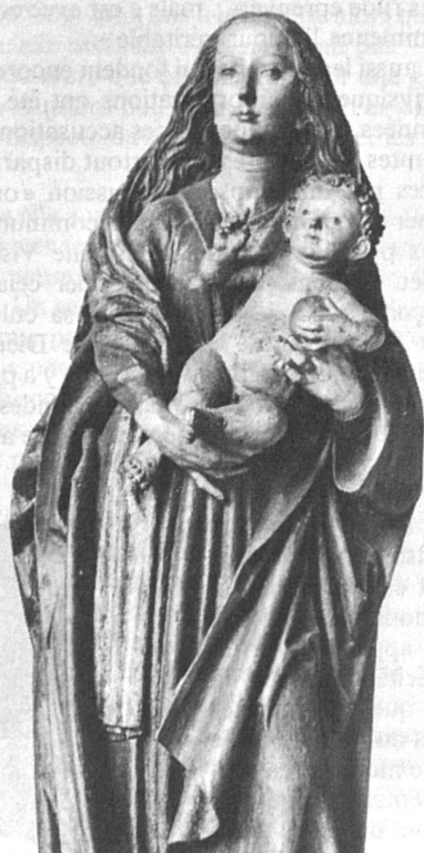
Gregor Erhart (Münich)

On peut d'abord se rappeler que le Christ a révélé sa résurrection en tout premier à des femmes, notamment à Marie-Madeleine. Celles-ci ont cru très rapidement mais lorsqu'elles ont couru l'annoncer aux autres, qu'ont-ils pensé ? « A des rêveries de ces femmes », et ils ne les ont pas crues ! Voilà donc le schéma masculin/féminin que l'on retrouve avec ces hommes qui ne voient dans le message des femmes qu'un bavardage alors que ce sont elles qui ont la vérité !