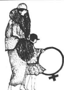
L'enfant au cerceau (42 x 61)