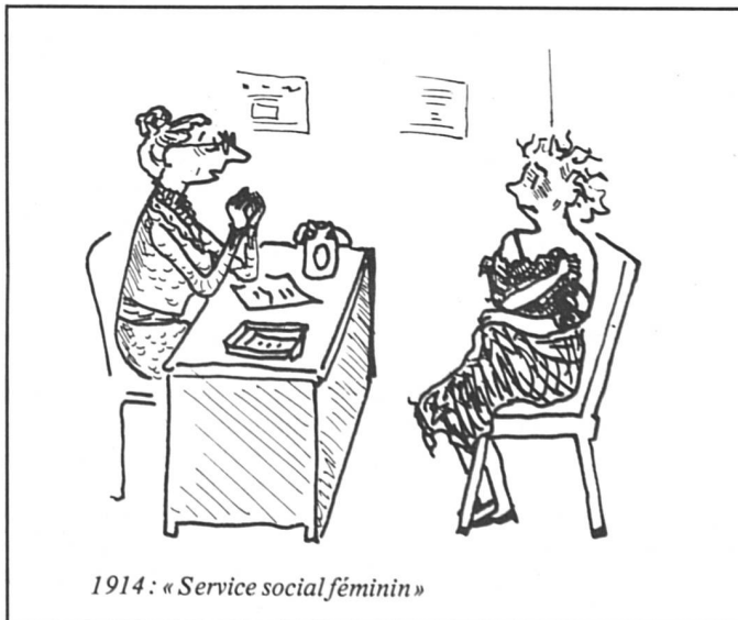
1914 : « Service social féminin »

Bon, puisque cette question n'a l'air d'intéresser personne sauf moi, on passe aux salaires. Faut-il faire une différence ? « L'égalité des salaires ne pose pas de problèmes très aigus car le travail n'est pas le même. Les hommes font des patrouilles de