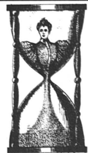
La femme au sablier (39 x 59)