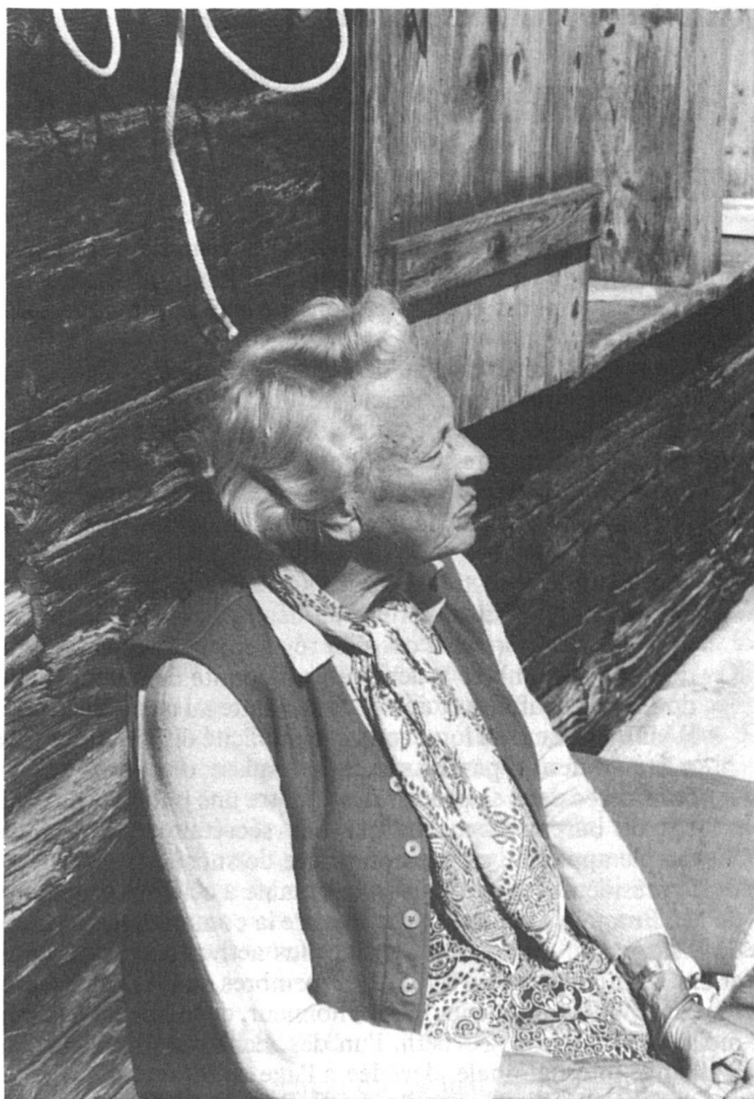
Ella Maillart aujourd'hui, devant son chalet de Chandolin (Valais) où elle passe six mois par année. ▲