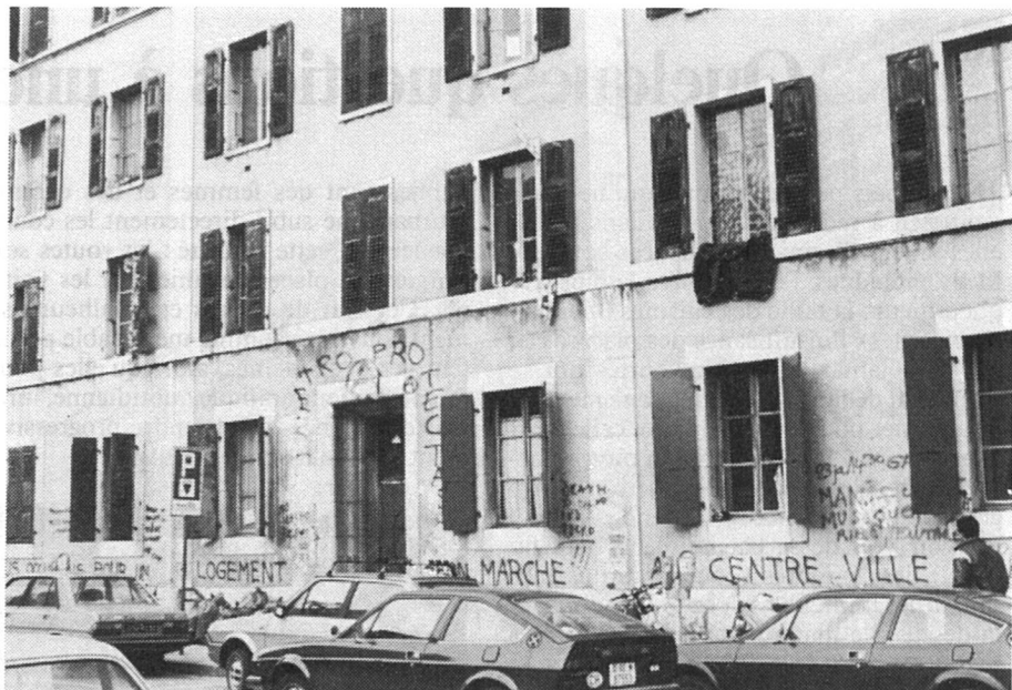
Immeuble «occupé» à Genève. Sur la façade: «Nous occupons pour un logement bon marché au centre-ville»

Puisque l'on peut aujourd'hui prévoir avec suffisamment d'exactitude la demande de logement en 1985, voire en 1990, l'on sait, toujours dans le cas de Genève, qu'il faudra, selon toute vraisemblance, 11 000 logements de plus d'ici deux ans. Mais si les autorités cantonales savent bien qui voudra quoi (en nombre de pièces), en 1990, elles ne savent ni où (banlieue ou centre ville), ni comment (grands ensembles ou petits immeubles locatifs, voire villas), bref, elles ne connaissent rien des atti-