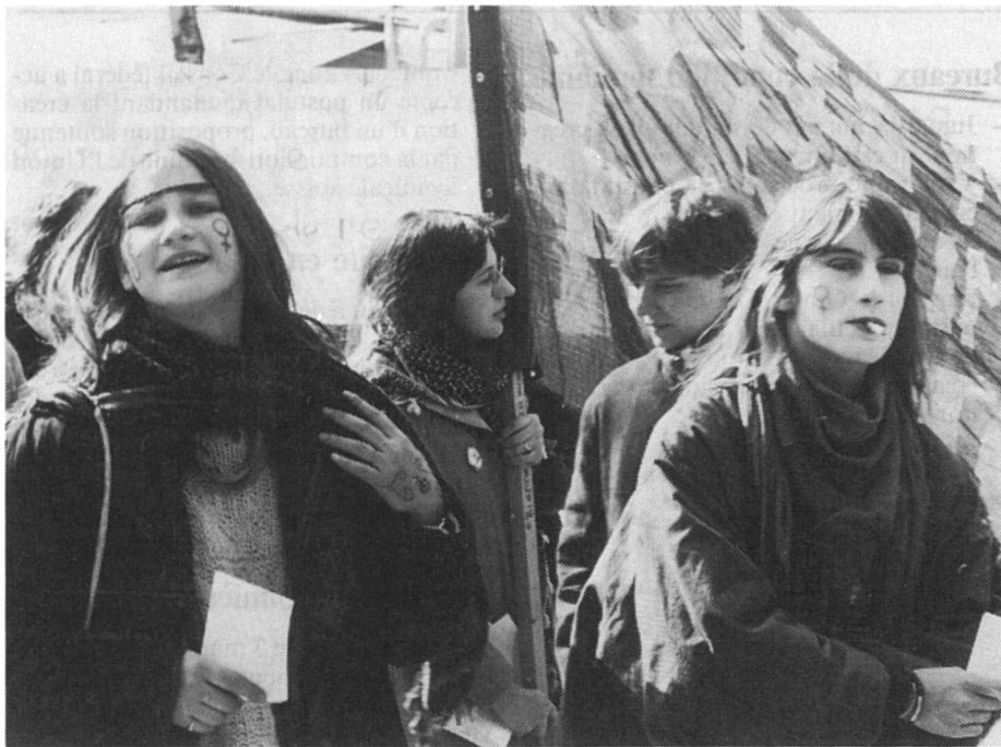
A Lausanne le 6 mars