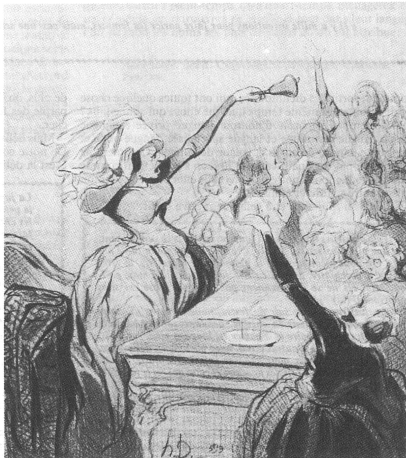
« Les intellectuelles ». Gravure Honoré Daumier