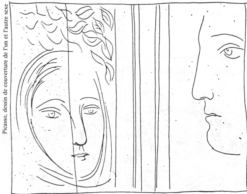
Picasso, dessin de couverture de l'un et l'autre sexe