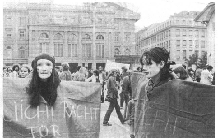
1980 : des féministes manifestent devant le Palais fédéral.

Le style a changé. Les revendications aussi. Et le féminisme... ?