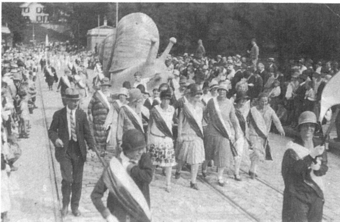
1928 : des féministes marchent vers le Palais fédéral.