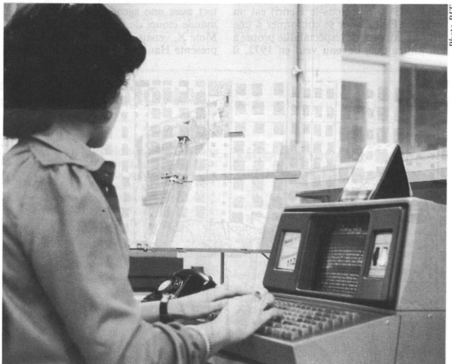
Une photocomposeuse au travail

L'ordinateur sert aussi bien à enregistrer des données et à les restituer instantanément sur demande, qu'à faire, à la seconde, des calculs qui auraient pris des heures ou des jours, ou qu'à commander des machines-outils, jusqu'aux robots y compris. Il est à la mémoire et au cerveau ce que l'outil