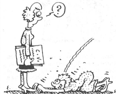
Ms. juin 1983