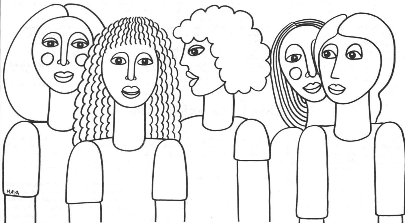
Dessin figurant sur le papillon de présentation du Centre-F à Genève