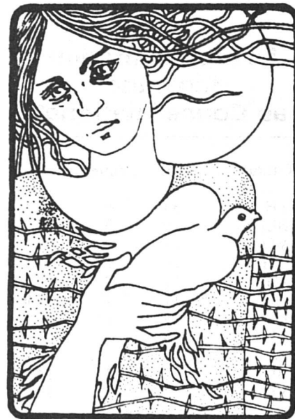
Dessin tiré de Info Service Civil, sept. 83.

Manifester en commun contre la menace de l'holocauste, est-ce « galvauder la paix sur la place publique d'une manière clownesque », comme le prétend le cdt de corps Edwin Stettler (Tribune de Genève du 4 novembre 1983) ?