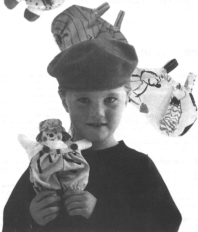
Un bricolage de « 100 idées »