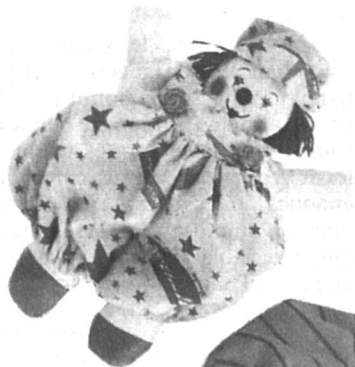
La garde-robe du petit clown... impossible à réaliser sans l'aide de maman