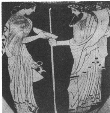
La déesse Perséphone apparaît ici comme la femme soumise, et même craintive, du dieu Hadès. Amphore grecque. (Louvre).