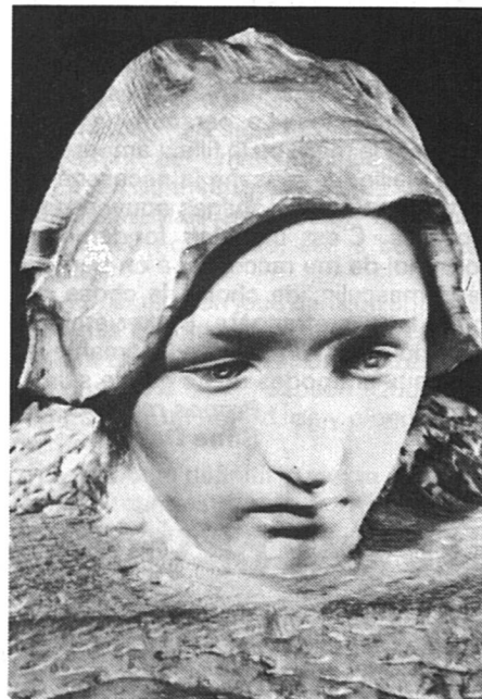
Camille Claudel servit de modèle à ce marbre de Rodin : « La Pensée ».

Et c'est bien au sculpteur que le Musée Rodin rend hommage, mais un sculpteur dont il se trouvait qu'il était une femme. A l'époque, ce n'était pas un handicap, c'était une tare. Qu'elles soient en bron-